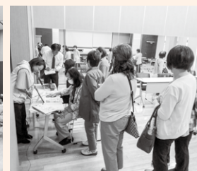
健康についてみなさん真剣に学習しました