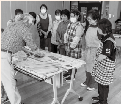
みなさん真剣に聞いていました