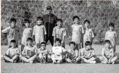
ひらた FC スポーツ少年団