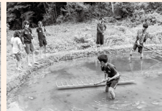
泥まみれになりながらがんばりました！