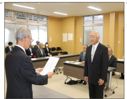
△澤村村長(左)から任命書を交付される農業委員